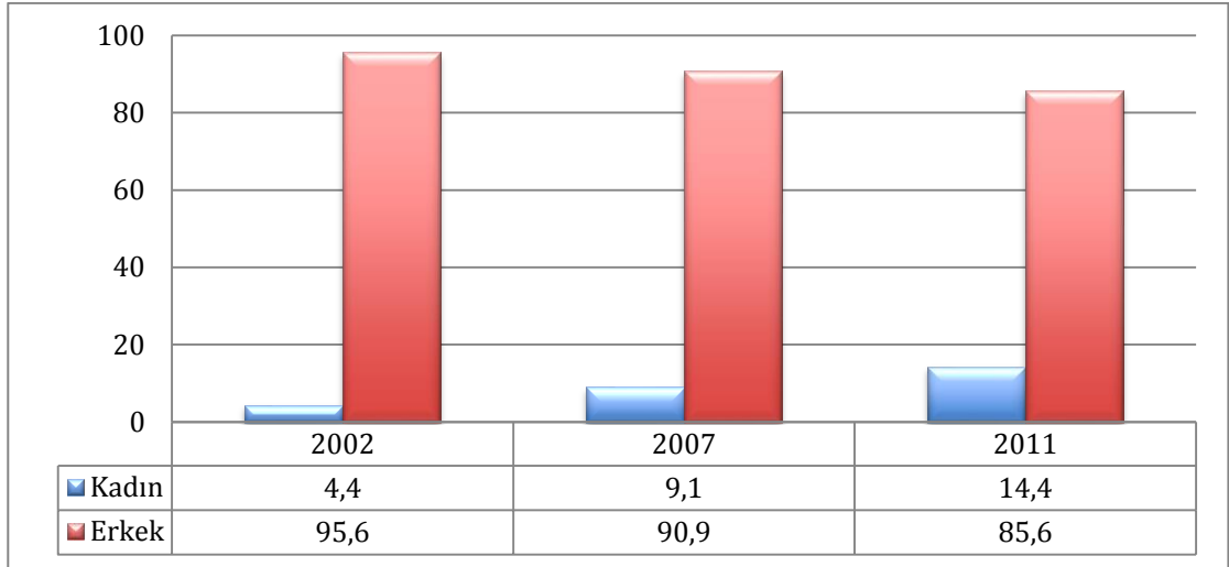
Tablo 5. TBMM'de Milletvekillerinin Cinsiyete Göre Dağılımı 2002-2011